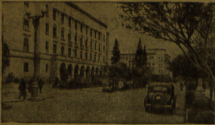
По городам Советского Союза. Улица Сталина в Кутаиси (Грузинская ССР).